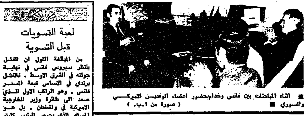
اتحاد المباحثات بين فانس وخدام بحضور اعضاء الوفدين السوري والسوري

عرض الرئيس حافظ الاسد الاقترح الخاص بتشكيل مجموعة عمل تضم وزراء خارجية دول المواجهة من اجل الامداد لوزير جنيف. واوضح الرئيس الاسد للمصاحفين السوريين الذين استقبلوه في دمشق ان هذا الاقتراح جيد. وقال الرئيس الاسد: ان المسألة ليست في رفض او قبول مجموعة العمل، التي لا يمكن ان نرى مقدماتها التي يمكن ان تحقق لنا النتائج المتوقعة.